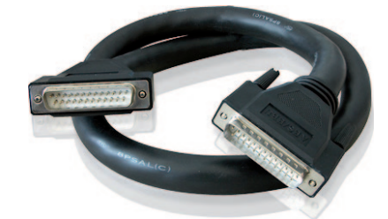
ALVA Digital-Kabel D-Sub25 male auf D-Sub25 male Verfügbar mit 1 m, 3 m und 6 m Länge.