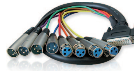
ALVA Breakout-Kabel D-Sub25 auf 4 x XLR-3 female + 4 x XLR-3 male Verfügbar mit 1 m, 3 m und 6 m Länge.

Die HDSPe AES verfügt über standardisierte 25-pol. D-Sub AES/EBU-Anschlüsse im TASCAM-Pinout-Format. Hochwertige D-Sub AES/EBU-Kabel mit XLR-Anschlüssen - 192 kHz-fähig - sind bei RMEs Partner ALVA erhältlich ( www.alva-audio.de ). Kabel mit TASCAM zu Yamaha Pinout und Format-Wandler sind ebenfalls verfügbar. Bitte fragen Sie Ihren Premium Line Händler.